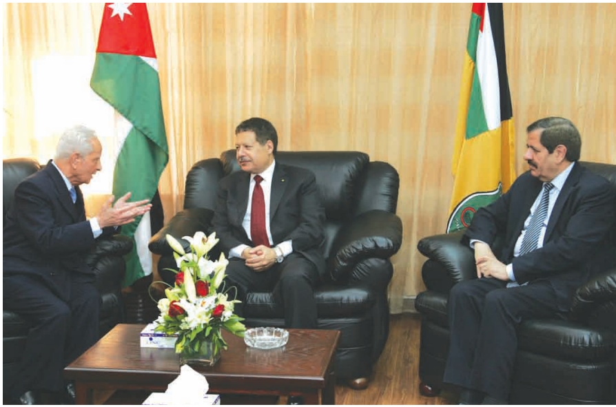
جولة الأستاذ أحمد اللوزي ورئيس الجامعة وحوار ودي مع الدكتور زويل

استقبل رئيس مجلس أمناء الجامعة دولة الاستاذ أحمد اللوزي في مكتبه في الخامس والعشرين من شباط العالم العربي أحمد زويل بحضور رئيس الجامعة الدكتور خالد الكركي ونواب رئيس الجامعة.