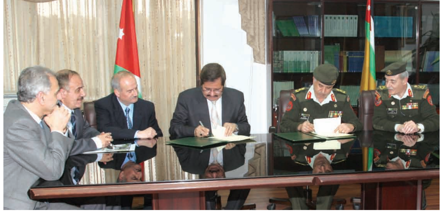
مراسم توقيع الإتفاقية

بدوره أعرب الدكتور الكركي عن اعتزازه بالإنجازات الطبية التي حققتها الخدمات الطبية الملكية التي تشكل رافداً حقيقياً في التنمية الطبية والصحية في الأردن العزيز.