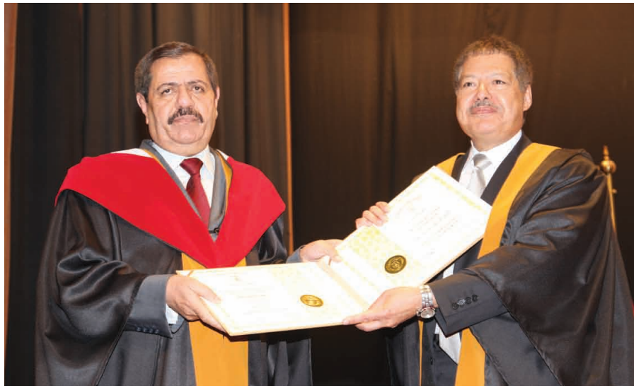
لحظة التقدير الأردنية

وتلا رئيس الجامعة الدكتور خالد الكركي نص براءة منح الدرجة التي قرر مجلس عمداء الجامعة وبناء على تنسيب من رئيس الجامعة منحها للدكتور زويل في احتفال كبير أقيم في مدرج الحسن بن طلال في الجامعة.