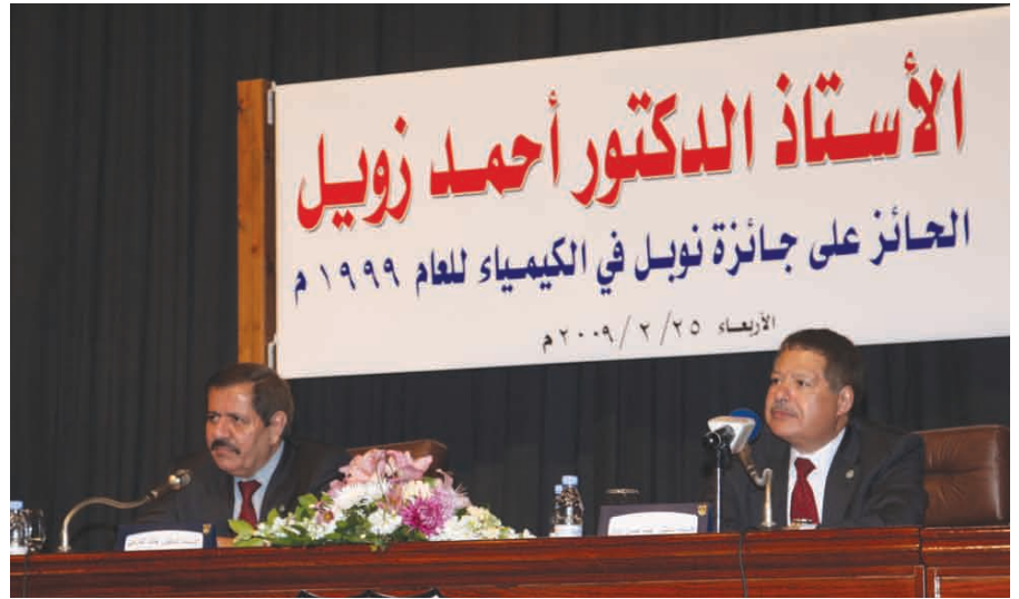
العالم زويل يتحدث للحضور

ضعف قوتها في الانتاج العلمي وضعفها الاقتصادي والسياسي، منتقدا توجه اهتمام الشعوب العربية نحو الترفيه بدلا من السعي الى العلم والثقافة من خلال شيوع استخدام تكنولوجيا المعرفة.